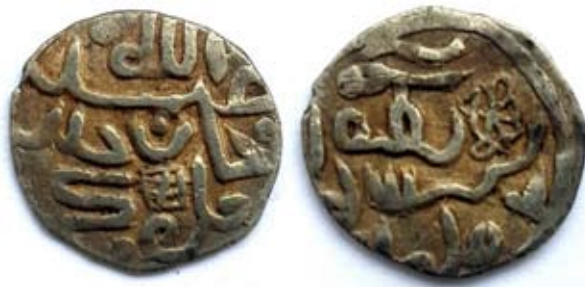
Рис. 18. Золота Орда. Данг хана Абдаллаха (1361–1370), карбування Орду, срібло, 1,1 г

Порівняємо його з фотозображенням однотипного данга на рис. 17. Легенди на монетах написані зі спотвореннями, на реверсі розміщено зображення нетрадиційно виконаного “вузла щастя”. Аверс данга на рис. 17 прикрашає “ornamentum monetale” з переплетених ліній. Графічний символ на лицьовому боці данга на рис. 18 ми схильні зарахувати радше до категорії сігла. Аргументацію буде подано нижче, розглянемо спочатку монету на рис. 19.