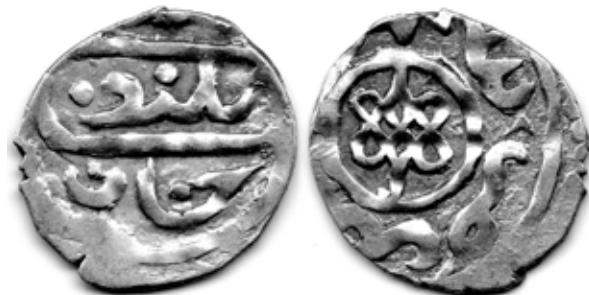
Рис. 15. Золота Орда. Данг хана Абдаллаха (1361–1370), без дати, монетний двір не прочитано, срібло, 0,95 г

Розглянемо ще один казус, що стосується диференціації тамг та “орнаментальних фігур”. На рис. 15–16 наведено фотозображення цікавого типу дангів хана Абдаллаха.