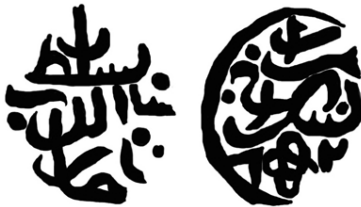
Рис. 6. Золота Орда. Графічна реконструкція відбитків штемпелів [Зайончковський, Шапошник, Арзуманова 2019, 182] монети хана Гіяса ад-Діна II (1423–1426), карбування Сарая, білон (?), 0,72 г

“Вузли щастя” розміщувалися на срібних золотоординських монетах з 1320-х рр. до середини XV століття. У літературі була висловлена думка про те, що такі прикраси монетного поля були запозичені з нумізматики держави Ільханів [Гончаров 2006], де вони активно використовувалися, на них там була створена своєрідна стилістична “мода”. Як ілюстрацію на рис. 7 вміщено фотозображення подвійного дирхема ільхана Сулеймана.