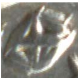
Рис. 23. Збільшене фотозображення сіглу на данзі хана Токтамиша

П. Савельєв, який опублікував цю монету з промальовуванням більш ніж півтора століття тому [Савельєв 1857, 88], ніяк не прокоментував графічний символ, уміщений на ньому (рис. 23). Сучасні дослідники, які виконали сітку штемпельних зв'язків відбитків штемпелів цієї емісії [Горлов, Казаров 2015, 49], також його проігнорували. Потрібно констатувати, що всі інші штемпелі із цієї групи монет “регулярного карбування” не несуть на собі нічого подібного. Ю. Зайончковський цей знак у формі хреста в ромбі колись зарахував до категорії “private mark” [Зайончковський 2016, 83].