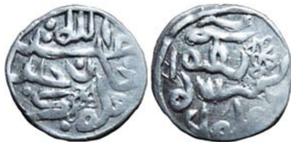
Рис. 17. Золота Орда. Данг хана Абдаллаха (1361–1370), карбування Орду, срібло

Переходячи до розгляду категорії сігла, звернемося до данга хана Абдаллаха, зображення якого відтворено на рис. 18.