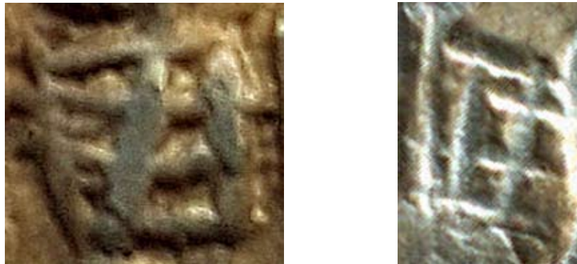
Рис. 20–21. Фотозображення сігла на дангах Абдаллаха та Мухаммада

Рис. 20 та 21 відтворюють збільшені фотозображення графічних знаків з репродукованих дангів Абдаллаха та Мухаммада.