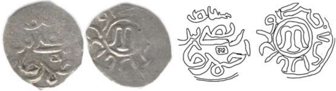
Рис. 10. Золота Орда. Срібна монета хана Муртази, карбування Орду-Базар, 0,49 г, без дати та промальовування цієї монети [Зайончковський 2016, 84]

Щоб дати читачеві загальне уявлення про знаки, що є предметом статті, на рис. 10 наведено зображення данга із сіглумом та графічну реконструкцію відбитків штемпелів цієї монети.