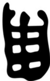
Рис. 25. Графічна реконструкція сіглу на данзі хана Бек-Суфі