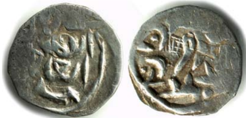
Рис. 19. Золота Орда. Данг хана Мухаммада (?), карбування Орду, 777 (?) р. г. (1375/1376 рр.(?)), срібло, 1,03 г

Цей тип дангів не був знайдений у науковій літературі. Його легенди, які мають палеографічні особливості написання, можна (як версія) прочитати так. Аверс: “Султан / справедливий / Мухаммад”. Йдеться про другого підставного хана Мамая. Напис на реверсі виконаний зі спотвореннями: “Карбування / Орду / 777”. Монета перекарбована, основою був інший данг. На реверсі монети розміщено сіглум.