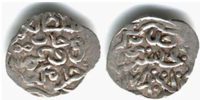
Рис. 13. Золота Орда. Данг хана Токтамиша, карбування Сарая, 795 р. г. (1392/1393 pp.), срібло, 1,37 г

Проаналізуємо ще один дискусійний символ. На рис. 13 відтворено данг хана Ток- тамиша, на аверсі якого можна побачити знак “∞”.