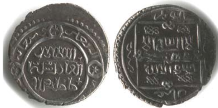
Рис. 7. Монгольський улус ільханів Хулагуїдів. Сулейман, 2 дирхеми, 740 р. г. (1339/1340 рр.), срібло, 1,75 г, карбування аль-Джазіра

“Вузли щастя” розміщувалися на срібних золотоординських монетах з 1320-х рр. до середини XV століття. У літературі була висловлена думка про те, що такі прикраси монетного поля були запозичені з нумізматики держави Ільханів [Гончаров 2006], де вони активно використовувалися, на них там була створена своєрідна стилістична “мода”. Як ілюстрацію на рис. 7 вміщено фотозображення подвійного дирхема ільхана Сулеймана.