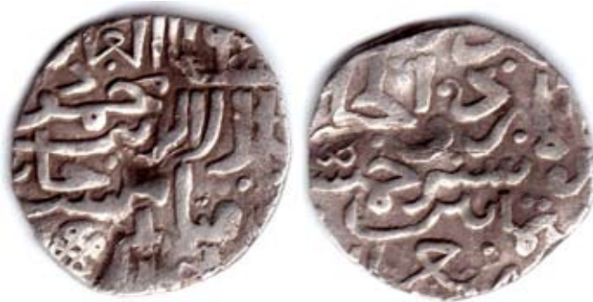
Рис. 12. Золота Орда. Данг хана Токтамиша, карбування Орду ал-Джадіда, 785 р. г. (1383/1384 pp.), срібло, 1,34 г

П. Савельєв, який опублікував цей тип у 1857 році, зазначив, що “в деяких при- мірниках тамга інша, а саме ☒” [Савельєв 1857, 98], тобто зарахував цей елемент до категорії тамг. М. Лихачов не погодився з ним: “Фігура у формі хреста цікава за контурями, але становить різновид звичайної хрестоподібної орнаментальної при- краси з чотирьох петель. Насправді лише загострення кутів утворюють справжній хрест...” [Лихачев 1928, 100].