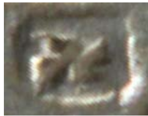
Рис. 11. Збільшене зображення загадкового знака на монеті хана Муртази

На рис. 11 винесено збільшене фотозображення знака, який ми зараховуємо до категорії сігла.