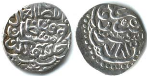
Рис. 22. Золота Орда. Данг хана Токтамиша, карбування Орду, 783 р. г. (1381/1382 pp.), срібло, 1,63 г