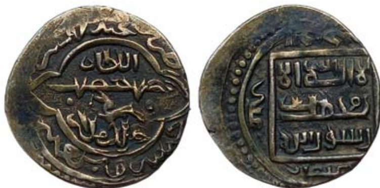
Рис. 8. Монгольський улус ільханів Хулагуїдів. Ануширван. 2 дирхеми, 750 р. г. (1349/1350 pp.), срібло, 1,20 г, монетний двір не прочитано

Цілком можливо, що таке припущення є істинним, але у зв'язку з цим виникає питання: чому золотоординські майстри не запозичили так само й “моду” на “мікробразження” тварин, які досить часто зустрічаються на монетах Ільханів? Як приклад такого зооморфу на рис. 8 поміщено зображення подвійного дирхема ільхана Ануширвана із зображенням між рядків легенди на аверсі маленького зайця, що біжить і дивиться назад. На джучидських срібних монетах нічого подібного не зустрічається.