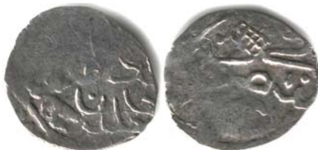
Рис. 24. Золота Орда. Данг хана Бек-Суфі (1419–1421), карбування Крим, срібло, 0,924 г

Ще один сіглум, на нашу думку, розташований на реверсі данга хана Бек-Суфі (рис. 24).