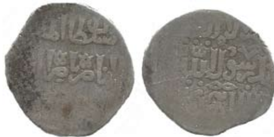
Рис. 14. Мамлюцький султанат, срібний дирхем, 693 р. г. (1293/1394 рр.), карбування Хама

На рис. 14 можна побачити срібний дирхем мамлюцького султана Мухаммада I, відкарбований у 693 р. г. (1293/1394 рр.) в місті Хама, розташованому в центральній частині сучасної Сирії. Майже в центрі його реверсу міститься знак “∞”. Ця монета, без жодних сумнівів, не має стосунку до “казахського племені Середнього Жузу”.