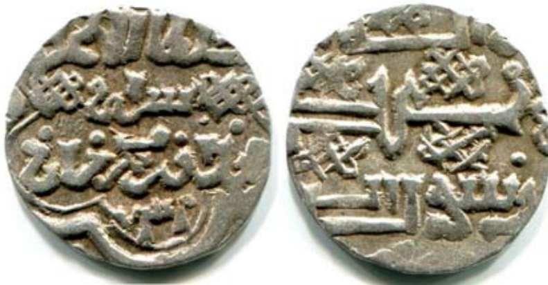
Рис. 3. Золота Орда. Данг хана Узбека, карбування Сарая, 739 р. г. (1338/1339 pp.), срібло, 1,54 г

Рис. 3–6 відтворюють фотозображення дангів, які мають такі елементи дизайну. Як бачимо, вузлів, що мали різну конфігурацію, могло бути від одного до чотирьох, і розміщувалися вони як на аверсах, так і на реверсах монет.