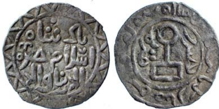
Рис. 1. Золота Орда. Срібна монета Криму, 2,08 г. Зараховують до карбування хана Берке (1257–1267) [Album 2011, 196]

Для нашого дослідження важливою є констатація того, що в оформленні монети ханська тамга застосовувалася як центральний, базовий елемент, навколо якого були розташовані інші елементи та легенди [Хромов, Хромова 2013, 29]. Монети на рис. 1 та 2 яскраво ілюструють наведене положення.