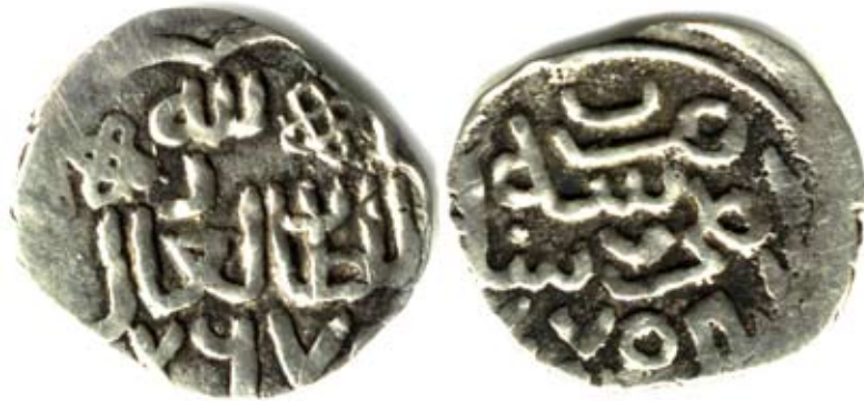
Рис. 5. Золота Орда. Данг хана Абдаллаха, карбування Кілія ал-Махруса, 770 р. г. (1368/1369 рр.), срібло, 0,84 г