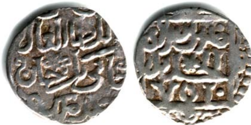
Рис. 4. Золота Орда. Данг хана Джанібєка, карбування Сарая ал-Джадіда, 752 р. г. (1351/1352 pp.), срібло, 1,51 г