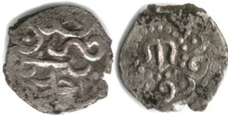
Рис. 2. Золота Орда. Срібна монета хана Муртази, карбування Кирк-Іера, 0,54 г, без дати [Зайончковский, Тишкин 2019, 104]

До другої групи знаків входять орнаментальні прикраси монетного поля, оформлені у вигляді безкінечного вузла, складеного з переплечених ліній. Для їхнього позначення в 1826 році Х. М. Френ запропонував термін “ornamentum monetale ☒” [Fraehn 1826, 219]. Ці знаки також часто називають “вузлами щастя”.