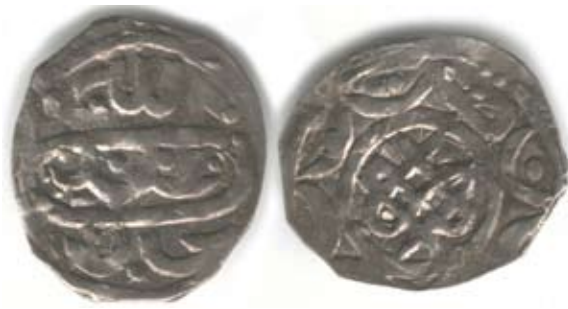
Рис. 16. Золота Орда. Данг хана Абдаллаха (1361–1370), без дати, монетний двір не прочитано, срібло, 0,84 г

У центрі реверсу монети на рис. 15 зображено “вузол щастя” у виконанні, близькому до класичного. Однак він зображений як центральний, самостійний елемент оформлення монети, навколо якого розташована легенда. Тобто займає місце тамги. На монеті на рис. 16 дизайн “вузла” відмінний від класичного, і теоретично можна поставити питання: чи ж не тамга це? Попередня відповідь: це все ж таки недбало виконане “ornamentum monetale ❁”. Остаточну відповідь дадуть сітки зв’язків графічних реконструкцій відбитків штемпелів, коли вони будуть виконані.