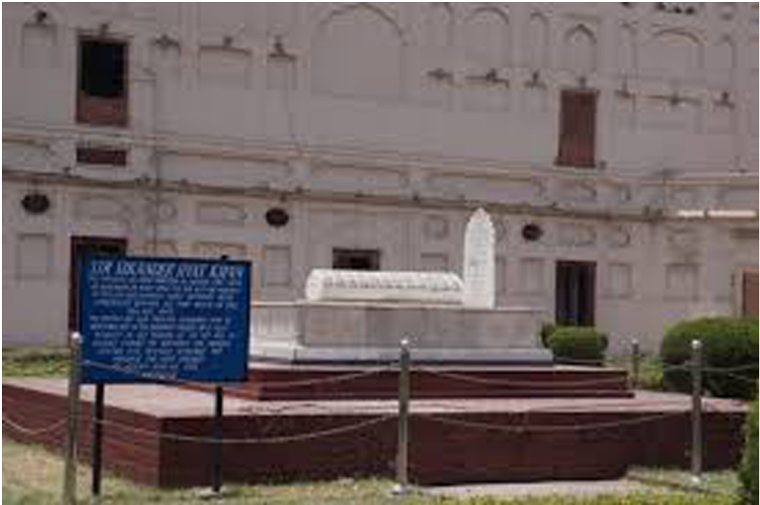
Іл. 4. Могила С. Х. Хана в Лахорському форті