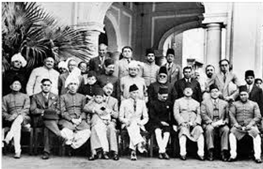
Іл. 2. Історичне засідання Мусульманської ліги в Лахорі, березень 1940 р. У центрі – М. А. Джинна, ліворуч від нього С. Х. Хан (тримає на руках дитину)