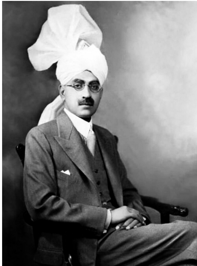
Іл. 1. Сер Сікандар Хаят Хан – головний міністр Панджабу