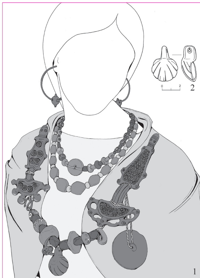
Рис. 5. Женское погребение первой четверти VII в. из склепа 154, из могильника у с. Лучистое. 1 – реконструкция убора погребенной; 2 – бронзовая подвеска из нагрудного ожерелья.

Иконография Хнубиса на перстне отличается от традиционной, принятой на геммах, только отсутствием вокруг головы лучей. Вместо них виден диск солнца или нимб. Возможно, мастер, изготовивший перстень, неудачно расположил изображение, занявшее все пространство узкой жуковины, и для лучей просто не осталось места. Не исключено, что это новшество в иконографии Хнубиса связано с влиянием христианства и декан