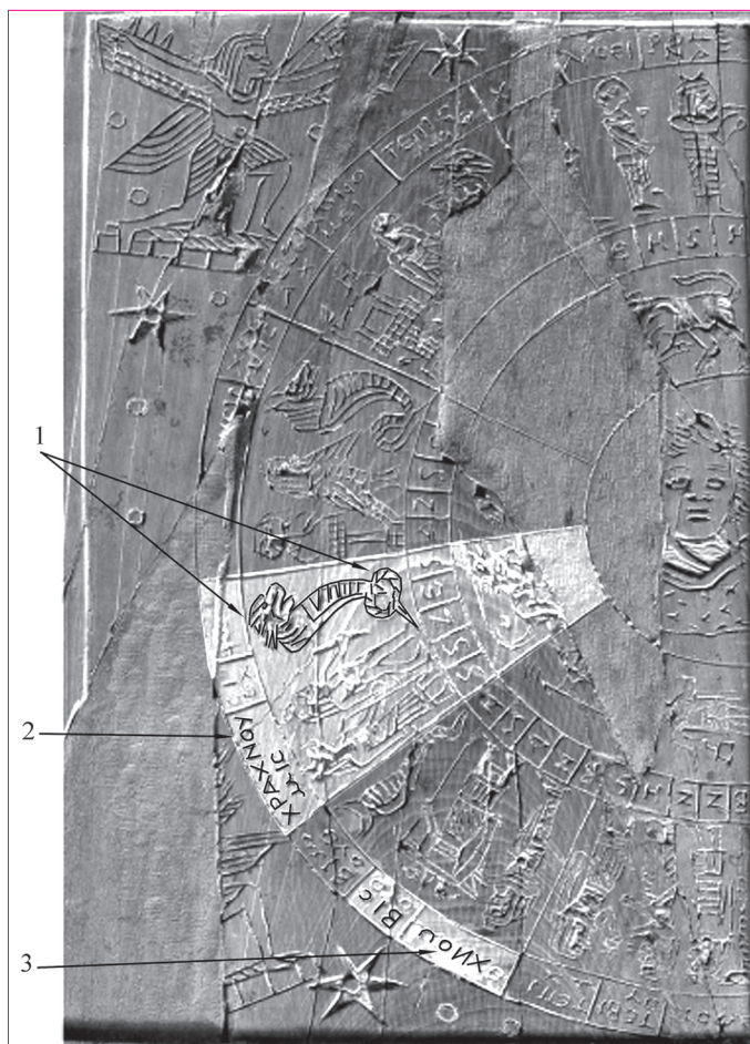
Рис. 3. Створка астрологического диптиха из слоновой кости второй половины II в. из галльского святилища Аполлона Граннуса в Гранде (Вогезы). По: [Les Tablettes astrologiques de Grand 1993, 95, pl. 3].

Следует учитывать, что геммы были, прежде всего, амулетами. Они должны были защищать своих владельцев и обеспечивать им здоровье, а не пропагандировать сложные