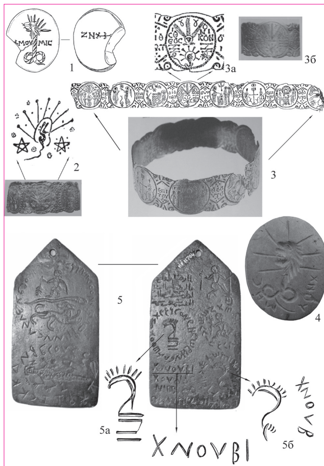
Рис. 4. Геммы (1, 4) и металлические амулеты (2, 3, 5) с изображением Хнубиса византийского времени. 1 – Коринф (по: [Davidson 1952, 225, kat. № 1777; fig. 39, 1777; pl. 101, 1777]; 2, 3 – Египет (по: [Maspero 1908, 247–248, fig. 1; Vikan 1991/92, 35, 37, fig. 9 b, 10 d.]); 4 – Афины, Нумизматический музей (по: [Everyday Live in Byzantium 2002, 99. Kat. № 85]); 5 – Париж, Лувр (по: [Bénazeth 1992, 285, № AF11704]).

льонами заполнено первыми строками псалма 90. В одном из медальонов видно уже знакомое по геммам изображение Хнубиса: тело змея выгравировано схематично, но зато хорошо проработана львиная голова на фоне солнечного диска с семью лучами (рис. 4, 2, 3a). Рядом присутствуют и характерные для магических инталий знаки, из которых наиболее отчетливо читается пентаграмма. Зная свойства Хнубиса, можно говорить о том, что в “обязанности” браслета входило и обеспечение здоровья желудка.