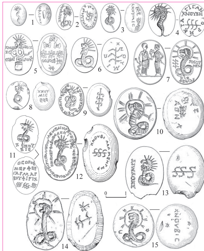
Рис. 2. Геммы III в. с изображением Хнубиса из коллекции Британского музея. 1 – CBd-91; 2 – CBd-693; 3 – CBd-692; 4 – CBd-125; 5 – CBd-698; 6 – CBd-701; 7 – CBd-691; 8 – CBd-144; 9 – CBd-706; 10 – CBd-702; 11 – CBd-690; 12 – CBd-700; 13 – CBd-703; 14 – CBd-703; 15 – CBd-711 (1–6, 8–15 – по: [The Campbell Bonner Magical Gems Database]; 7 – по: [Dasen, Nagy 2012, 306, fig. 9]).

Во II–III вв. культы пантеистических богов гностицизма проникают в Северное Причерноморье [Кобылина 1978, 110–120]. В этот период в античных центрах – Херсонесе, Пантикапее и Феодосии – распространяются магические гностические геммы, среди которых особой популярностью пользовались инталии с Хнубисом [Неверов 1978, 165–166]. Найденные в Крыму камни Хнубиса датируют III в. Две инталии, происходящие