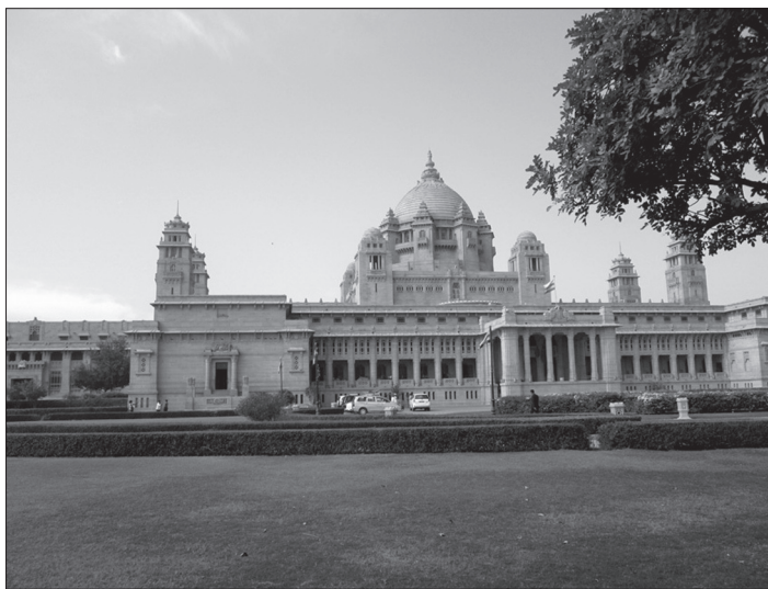
Мал. 2. Умайд Бхаван

Умайд Бхаван був побудований магараджею Умайдом Сінгхом (мал. 2). Фундамент заклали в 1929 році, але фактично палац постав у 1943. Зараз він розділений на три частини. В одній із них досі мешкає королівська сім'я. Друга – залишена під найкращий у місті люксовий готель, а в останній розташований музей, присвячений історії королівської родини Джодхпура. Туристи мають можливість споглядати розкішні інтер'єри, колекції порцеляни та зброї, численні фотографії, нагороди та інші особисті речі, що належали мешканцям бхавану (палацу). Я неспішно ходила музеєм, роздивляючись усю цю красу, як раптом мій погляд зупинився на двох тумбах з екранами та інформаційному стенді біля них. Мені одразу це здалося дивним, адже раніше новітніх технологій в індійських музеях я не бачила. Підійшовши ближче, прочитала заголовок: "Stefan Norblin (1892–1952)". Виявилось, що над інтер'єрами Бхавану в роки Другої світової працював польський художник-модерніст Стефан Норблін. У 1939 році раджа Гадж Сінх запросив його розробити дизайн приміщень, що включало олійний розпис стін та меблювання. Художник власноруч працював над багатьма інтер'єрами в палаці, проте найбільше вражають покої раджі, розписані сценами з Рамаїни. Я надовго затрималася біля стенда, бо дуже приємно було ось так раптом побачити частинку Європи тут, в Індії. І ще мимоволі посміхнулася, зрозумівши причину