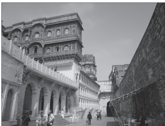
Мал. 1. Мехрангарх (форт зсередини)

Зараз, говорячи про Індію, вже не має сенсу згадувати її контрастність, дивовижне поєднання традиційного і сучасного, добродушний характер її жителів, неспішний плин часу в ній і водночас шалений темп та метушню на вулицях великих міст. Навряд чи когось здивує розповідь про корів на дорозі чи халупи в центрі мегаполіса. Всі ці речі давно стали маркерами сучасної Індії для європейця і можуть викликати лише одне запитання в того, кому ще не пощастило відвідати цю дивовижну країну: