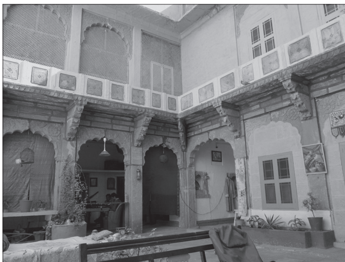
Мал. 3. Внутрішній двір будинку раораджі

Крім того, землями у князівстві володіли інші сім'ї, наближені до короля. Головні представники цих сімей мали титул "раораджа". З нащадком однієї з таких сімей мені довелося поспілкуватися і навіть побувати в його домі.