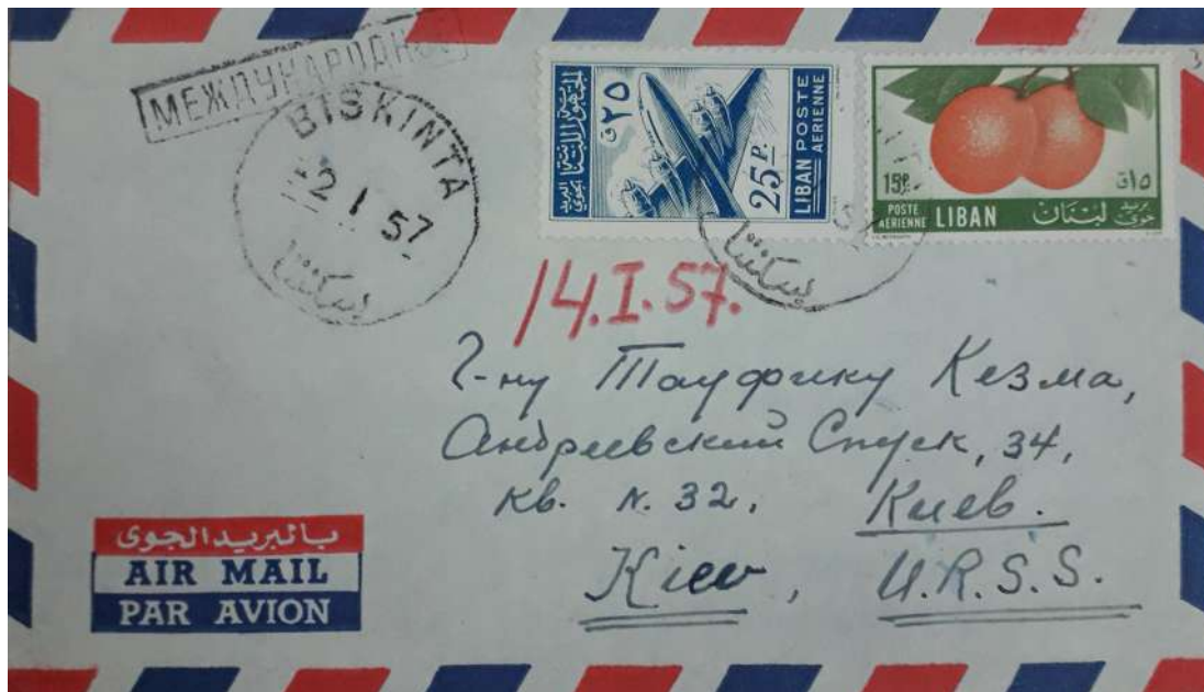
Іл. 2. Конверт листа Михайла Нуайме від 1 січня 1957 р. [ІР НБУВ, ф. 173, № 101]

Мою адресу зазначено у верхній частині першої сторінки листа. Можете додати до неї російською в дужках ( Бейрут – Ливан ), і цього достатньо.