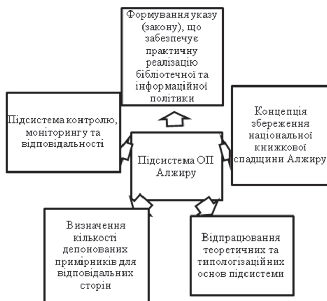
Схема 2. Загальна характеристика підсистеми ОП Алжиру

Підсистема ОП Тунісу еволюційно формувалася з положень законів, що забезпечували контроль за функціонуванням прес-служб та книжкової торгівлі. Тому і Закон № 32 від 28 квітня 1975 р. “Про видання Кодексу преси” зберіг у своїй назві залишки іншої інформаційної підсистеми. ОП Тунісу і його теоретична база перебувають на “перехідному етапі” руху від концепцій видавничої справи та преси до функціонального розуміння обов’язкового примірника як окремої складової національного бібліотечно-інформаційного простору. Це означає, що всі особливості депонування на початкових етапах розробки та планування корелювали з теоретичними аспектами діяльності прес-служб, видавництв, друкарень, фірм із продажу книг. Відповідно, і сам підхід у своїй кінцевій реалізації є “змішаним”. Бібліотечні погляди на збереження національної книжкової спадщини тут існують поряд з виділенням спеціальних адміністративних документів, документів “міського значення” або локального значення, комерційної документації від матеріалів, що мають безпосередню цінність для підсистеми ОП. Загальну характеристику підсистеми ОП Тунісу розглянемо на схемі 3: