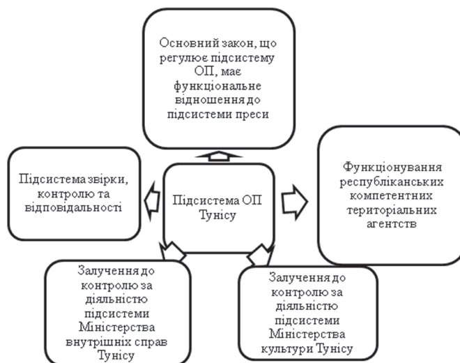
Схема 3. Загальна характеристика підсистеми ОП Тунісу

Підсистема ОП Тунісу еволюційно формувалася з положень законів, що забезпечували контроль за функціонуванням прес-служб та книжкової торгівлі. Тому і Закон № 32 від 28 квітня 1975 р. “Про видання Кодексу преси” зберіг у своїй назві залишки іншої інформаційної підсистеми. ОП Тунісу і його теоретична база перебувають на “перехідному етапі” руху від концепцій видавничої справи та преси до функціонального розуміння обов’язкового примірника як окремої складової національного бібліотечно-інформаційного простору. Це означає, що всі особливості депонування на початкових етапах розробки та планування корелювали з теоретичними аспектами діяльності прес-служб, видавництв, друкарень, фірм із продажу книг. Відповідно, і сам підхід у своїй кінцевій реалізації є “змішаним”. Бібліотечні погляди на збереження національної книжкової спадщини тут існують поряд з виділенням спеціальних адміністративних документів, документів “міського значення” або локального значення, комерційної документації від матеріалів, що мають безпосередню цінність для підсистеми ОП. Загальну характеристику підсистеми ОП Тунісу розглянемо на схемі 3: