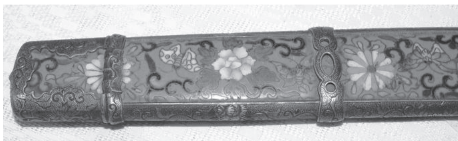
Рис. 5. Металеві смуги піхов амаої та сібабікі