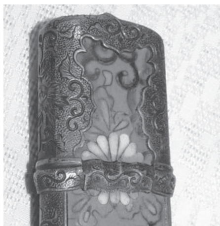
Рис. 2. Наконечник піхов саядзірі