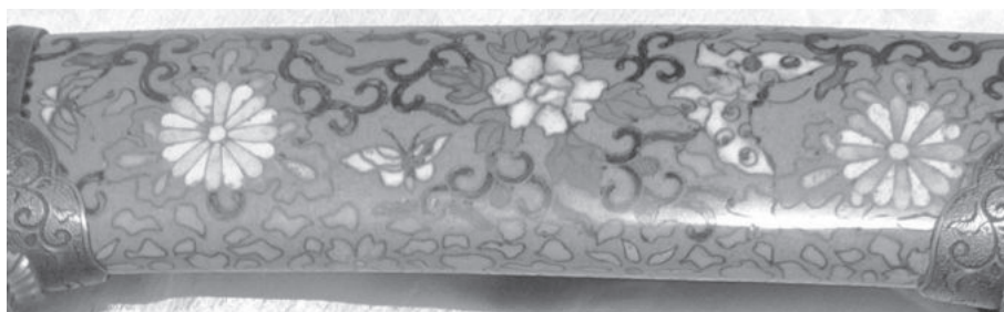
Рис. 12. Фрагмент декорованих піхов