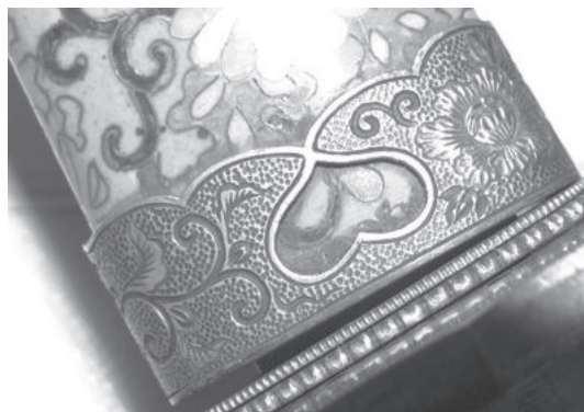
Рис. 11. Фрагмент декорованих піхов