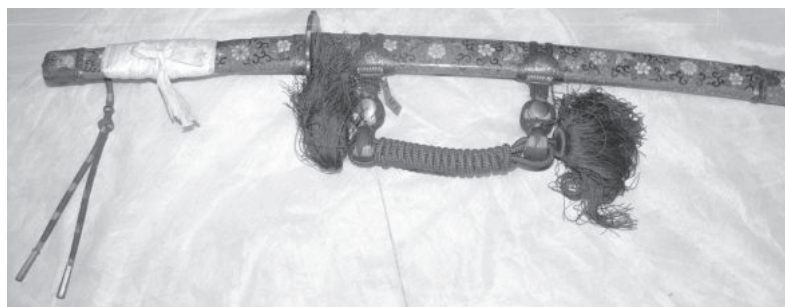
Рис. 1. Tati : загальний вигляд