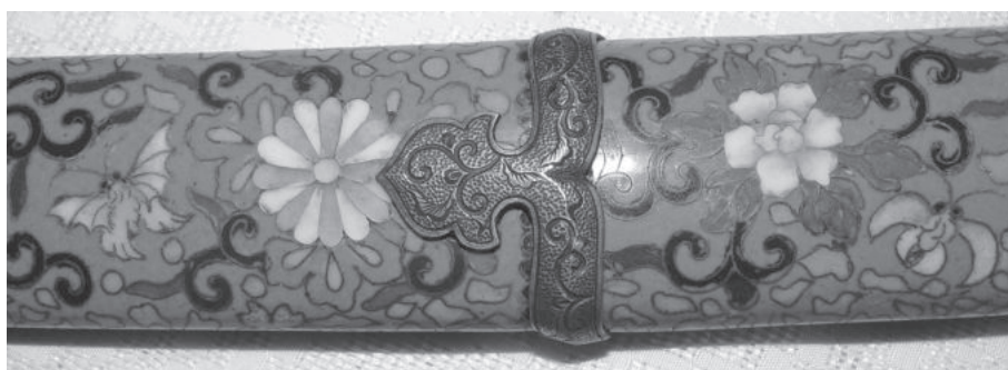
Рис. 3. Стягуючі кільця семе-тане