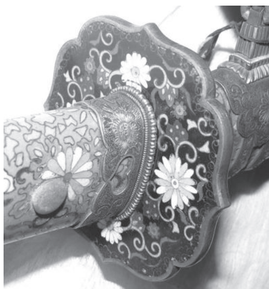
Рис. 9. Аoi-гата-цуба; основа руків'я меча цука, оправлена кільцем футі-канамоно; штир мекуті