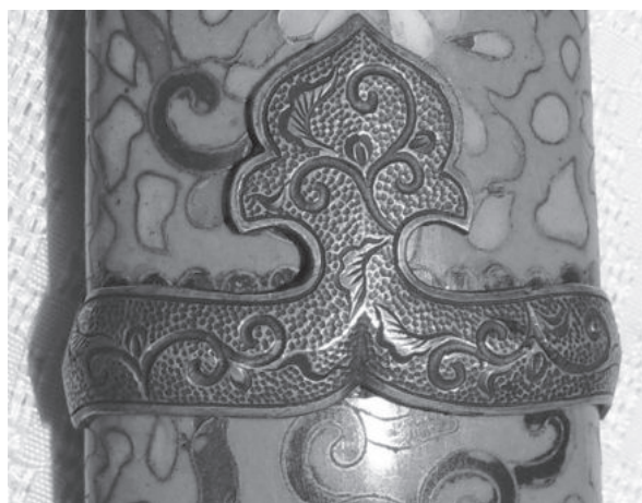
Рис. 4. Стягуючі кільця семе-тане