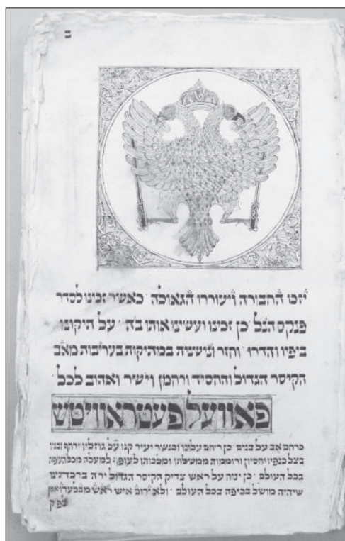
Рис. 2. Подяка цареві з пінкаса товариства “Відвідування хворих” з Кам’яця-Подільського