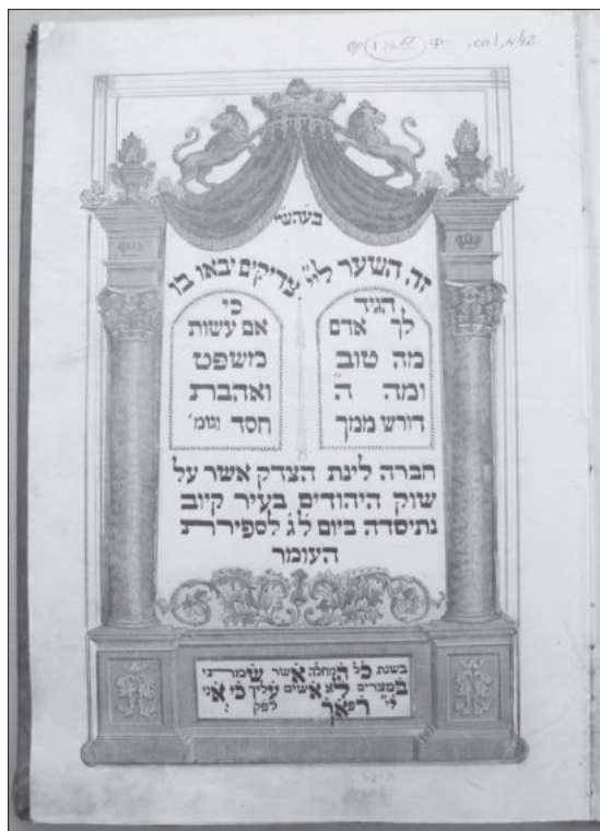
Рис. 1а. Титульна сторінка [записника] товариства “Доброчесного притулку” з Києва