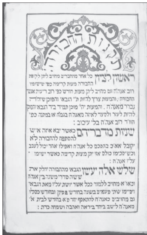
Рис. 5. Початок статуту товариства вивчення Мішни й Вавилонського Талмуду з Бердичева