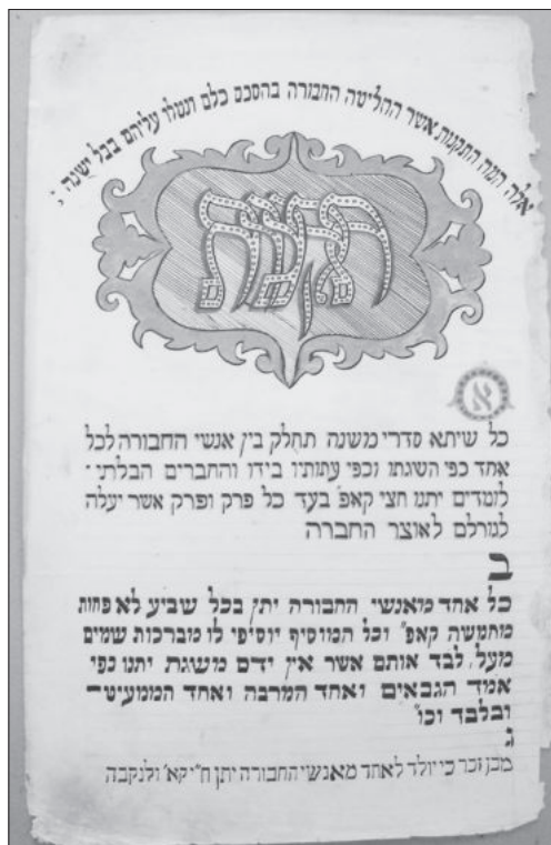
Рис. 4. Початок статуту товариства вивчення Мішни з Бердичева