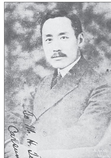
Рис. 1. Чжан Цзюньмай

Проникнення в Китай аналітичної філософії пов’язане з працями і педагогічною діяльністю англійського філософа Б. Рассела, який із жовтня 1920-го по липень 1921 року прочитав лекційні курси в Пекінському університеті: “Проблеми філософії”, “Аналіз матерії”, “Аналіз розуму”, “Соціальна структурологія”. Уявлення Б. Рассела про логіко-аналітичний метод філософії, його критика прагматистського розуміння істини Д. Дьюї та інтуїтивістської гносеології А. Бергсона, твердження об’єктивності джерела пізнання, емпіричної перевірки істинності і науково-доказового підходу до філософських проблем вплинули на філософське співтовариство Китаю. Уже в 1920-х роках у Китаї виникла філософська дискусія про науку (科学, kēxué ) і метафізику (玄学, xiánxué ), у ході якої “прихильники науки” (або “західники”) обстоювали необхідність розвитку Китаю відповідно до західних зразків, а “прихильники метафізики” під враженням від руйнівних наслідків Першої світової війни твердили про кризу “матеріалістичної” західної культури, віддаючи пріоритет “духовності” Сходу. Імпульсом для початку дискусії стала лекція “Світогляд” (“人生观”, “ Rénshēng guān ”) відомого китайського філософа Чжан Цзюньмая (张君勱, 1886–1969), прочитана ним у лютому 1923 року в Пекінській школі Цінхуа (згодом – це Університет Цінхуа). Чжан Цзюньмай, погляди якого сформувалися під сильним