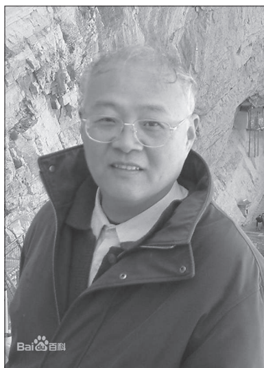
Рис. 9. Чжао Дуньхуа

У Китаї спостерігається істотний прогрес у розвитку ключового напрямку для аналітичної традиції – філософії мови , – повноцінне вивчення і розвиток якого розпочалися після появи двотомного дослідження “Аналітична філософія та її розвиток у США” Ту Цзіляна (涂纪亮, 1926–2012) [涂纪亮 1987]. Крім того, Ту Цзілян виступив редактором збірки найважливіших творів англо-американської філософії мови за останні десятиліття [涂纪亮编 1988], керівником перекладу на китайську мову зібрання творів У. Куайна “蒯因著作集” в 6 томах [涂纪亮等 2007], найповнішого у світі зібрання праць Л. Вітгенштейна у 12 томах (6 із яких він переклав сам) [涂纪亮等 2003], а також написав фундаментальне дослідження “Філософські думки Вітгенштейна” (“维特根斯坦后期哲学 思想研究”) [涂纪亮 2005]. Ту Цзілян наполягає на тому, що філософію мови слід розглядати як самостійний напрям філософії, представлений різними школами в різних традиціях думки. При цьому у своїх монографіях “Англо-американська філософія мови” (“英美语言哲学”) [涂纪亮 1993] і “Сучасна континентальна філософія мови” (“现代欧洲大陆语言哲学”) [涂纪亮编 1994] на основі порівняльного аналізу Ту Цзілян виділяє загальні для них підходи: 1) мова – це предмет