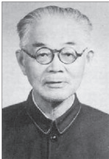
Рис. 4. Чжан Дайнянь

Дискусія про науку і метафізику мала важливе значення для загальної постановки питання про місце науки в модернізації китайського суспільства, а також відбувся суттєвий вплив сцієнтизму та позитивізму на традиційну китайську філософію. Цю дискусію вважають першим конфліктом між аналітичною філософією і традиційною китайською філософією, яка на той момент взяла гору. Однак, як відзначають Цзян І і Бай Тундун, аналітична філософія не зникла в Китаї, а стала новою філософською теорією [Jiang Yi 2009, 4]. Деякі китайські філософи навіть намагалися використовувати методологію аналітичної філософії для вивчення і розвитку традиційної китайської філософії. На цьому етапі вони займалися поширенням і вивченням аналітичної філософії. Наприклад, у 1927 році один з головних засновників Комуністичної партії Китаю, політичний діяч, філософ і математик Чжан Шеньфу (张申府, 1893–1986) переклав та опублікував “Філософський трактат” Вітгенштейна (“名理论”, “Mínglǐ lùn”, який зараз прийнято перекладати “逻辑哲学论”, “Luójí zhéxué lùn”). Чжан Шеньфу був не тільки першим і надалі провідним фахівцем з вивчення філософії Б. Рассела в Китаї, а й створив власну концепцію, в основі якої лежить поняття “чистого об’єктивізму” (“纯客观论”, “chún kèguān lùn”), що базується на незвичайному поєднанні “гуманізму” Конфуція і “наукового методу” Б. Рассела – “двох найважливіших цінностей світу”, на думку філософа [张申府 1931, 2].