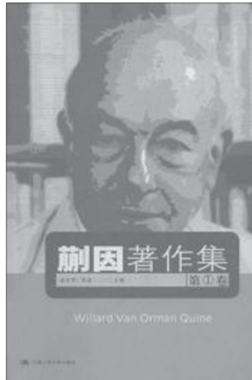
Рис. 12. Обкладинка 6-томного зібрання творів У. Куайна в перекладі на китайську мову

Низка важливих досліджень були виконані представниками нового покоління китайських філософів, які спеціалізуються на вивченні аналітичного напрямку, – це роботи Сюй Ююя “Коперніканська революція, лінгвістичний поворот у філософії” («“哥白尼式”的革命 – 哲学中的语言转向») [徐友渔 1994], Цзян І “Вітгенштейн: постфілософська культура” (“维特根斯坦:一种后哲学文化”) [江怡 1996], Чень Бо “Дослідження філософії Куайна з логічної та лінгвістичної перспективи” (“奎因哲学研究: 从逻辑和语言的观点看”) [陈波 1998], Чень Яцзюня “Прагматизм: від Пірса до Патнема” [陈亚军 1999] та ін. Аналітичний підхід використовується в роботі Фен Яоміна “Методологічні проблеми китайської філософії” (“中国哲学的方法论问题”) [冯耀明 1989].