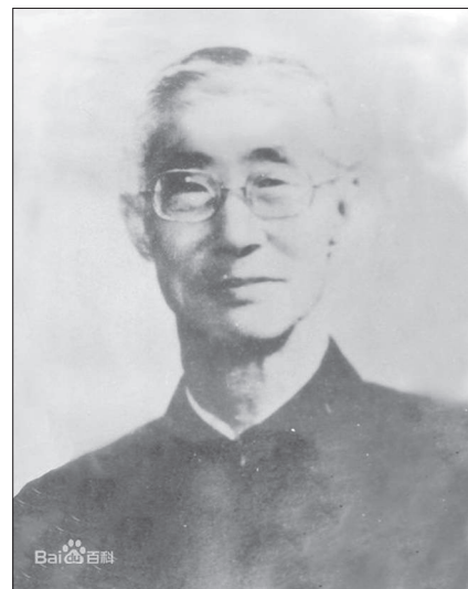
Рис. 6. Хун Цянь

Однак у результаті Чжан Шеньфу не вдалося поєднати китайський “гуманізм” та аналітичну логіку, до яких він пізніше ще намагався додати і діалектичний матеріалізм [Shwarcz 1991–1992]. Схожий проект здійснював його молодший брат Чжан Дайнянь (张岱年, 1909–2004), чий філософські погляди сформувалися в 1930-ті роки під впливом марксистського діалектичного матеріалізму та аналітичної філософії Дж. Мура, Б. Рассела та А. Вайтхеда. У першій половині 1930-х років у своїх філософських роботах він прагне синтезувати сучас-