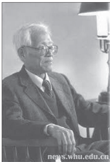
Рис. 7. Цзян Тяньцзі

У цей період контакти із західними вченими були можливі тільки для тих китайських вчених, які жили на Тайвані, острові, який не увійшов до складу Китайської Народної Республіки і до сьогоднішнього дня залишається “осколком” громадянського конфлікту, що тривав протягом 1920–1940-х років.