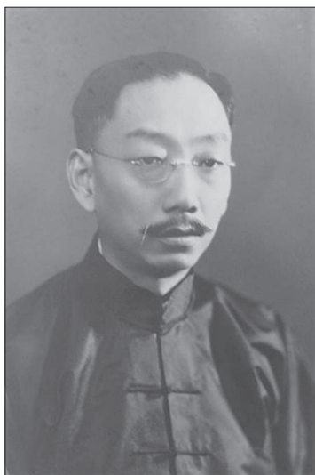
Рис. 2. Дін Венцьзян

ли на філософське співтовариство Китаю. Уже в 1920-х роках у Китаї виникла філософська дискусія про науку (科学, kēxué ) і метафізику (玄学, xiánxué ), у ході якої “прихильники науки” (або “західники”) обстоювали необхідність розвитку Китаю відповідно до західних зразків, а “прихильники метафізики” під враженням від руйнівних наслідків Першої світової війни твердили про кризу “матеріалістичної” західної культури, віддаючи пріоритет “духовності” Сходу. Імпульсом для початку дискусії стала лекція “Світогляд” (“人生观”, “ Rénshēng guān ”) відомого китайського філософа Чжан Цзюньмая (张君勱, 1886–1969), прочитана ним у лютому 1923 року в Пекінській школі Цінхуа (згодом – це Університет Цінхуа). Чжан Цзюньмай, погляди якого сформувалися під сильним