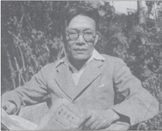
Рис. 5. Цзінь Юелінь

ний матеріалізм, метод логічного аналізу і традиційну китайську філософію, яка, на думку Чжан Дайняня, прагне до об'єднання феномена та реальності, матеріального та ідеального [张岱年 1993, 2]. Таким чином, з позицій методологічного плюралізму робилася спроба здійснити взаємодоповнювальний синтез діалектичного і логіко-аналітичного методу. Згодом цей підхід став широковідомий як “доктрина творчого синтезу”, яка була оформлена в оригінальну філософську систему.