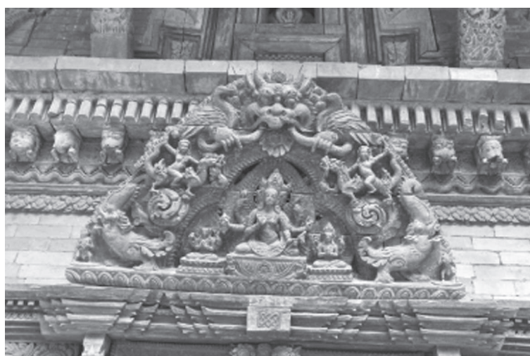
Іл. 2. Тимпан північного portalу пагоди Сваямбгу-ступи (чайт'я). Центральне зображення – будда Амогхасіддгі