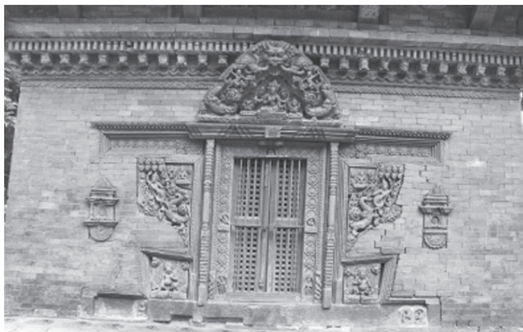
Іл. 1. Північний портал пагоди Сваямбгу-ступи 25