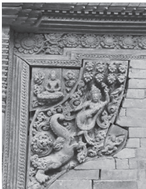
Іл. 4. Бокова вставка північного порталу пагоди Сваямбгу-ступи