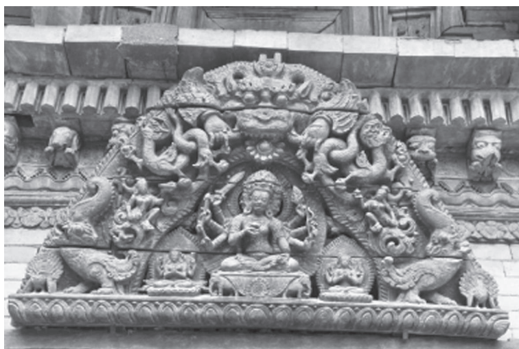
Іл. 6. Тимпан східного порталу пагоди Сваямбгу-ступи