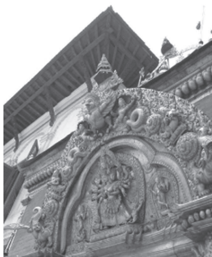
Іл. 7. Тимпан порталу (“Золотих воріт”) храмово-палацового комплексу у Бхактаपुरі