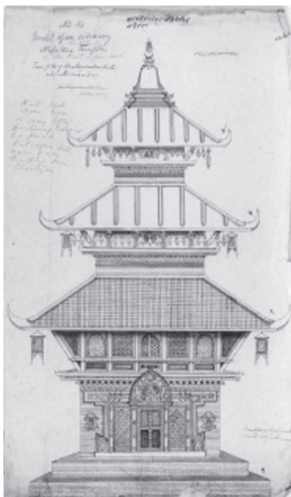
Іл. 9. Традиційна непальська пагода типу кутагар . Старовинний непальський малюнок (з колекції Б. Ходжсона) [Losty 2004, 90–91]