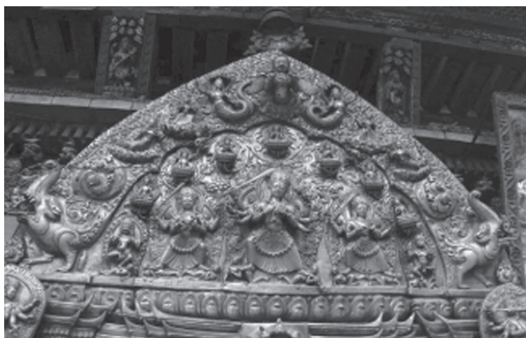
Іл. 5. Тимпан порталу пагоди Ваджрайогіні