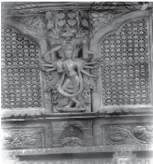
Іл. 10. Амитабга, зображений на балці між вікон Золотого храму, Ква Баха, Лалітпур. Бл. 1409 р.