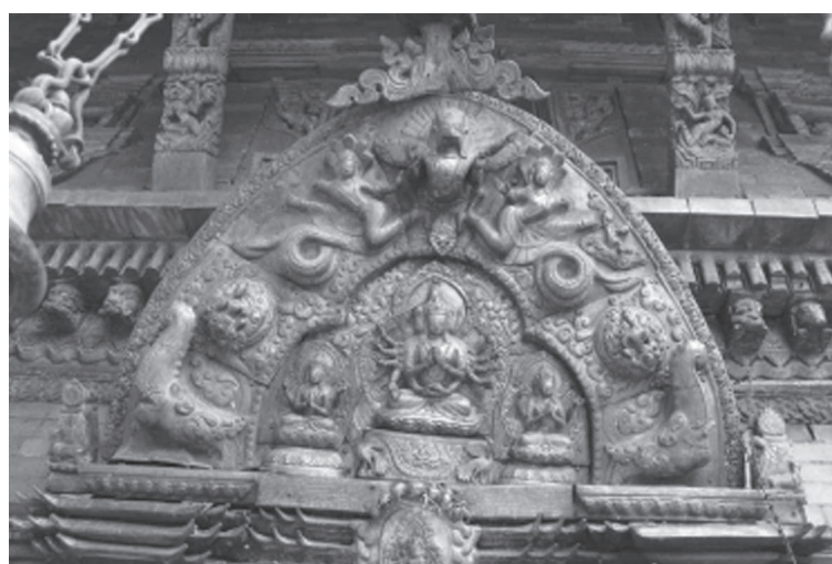
Іл. 3. Тимпан західного portalу пагоди Сваямбгу-ступи (із зображенням будди Амітабги)