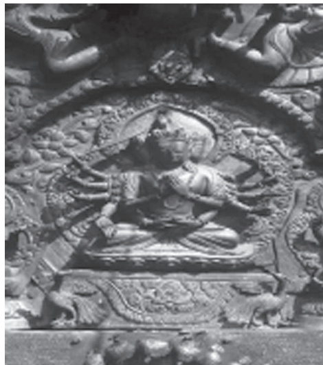
Іл. 11. Амитабга, зображення на торані храму Самовиявленої мудрості Будди