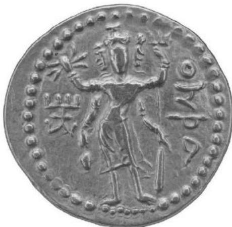
Мал. 1. Кушанська монета із зображенням Оадо (Вайу), London, British Museum (за: [Shenkar 2014, 334, fig. 147])

Структурно Яшті розрізняються за обсягом, характером змісту та поетичною структурою. За обсягом Яшті діляться на великі (напр., Яшт 13: 158 строф) та малі (напр., Яшт 21: 1 строфа). За характером змісту та поетичною структурою Яшті розподіляються на такі типи: ‘легенди’, ‘гімни’, ‘малі твори (апотропеїчного характеру)’ (‘legendary,’ ‘hymnic,’ ‘minor’) [Hintze 2014]. Відповідно до цих параметрів, Яшт 15 за обсягом належить до великих Яштів , а за типом він є гімном божеству Вайу, який є втіленням певного природного феномену, тобто належить до третьої групи богів іранського пантеону. Вайу – божество повітря та атмосфери, яке виступає як покровитель воїнів (пехл. Wāy ī weh ) 2 та бог смерті (пехл. Wāy ī wattar ), причому останній аспект надає йому додаткову темпоральну контамінацію 3 . Мистецтво Ірану не знає візуального образу Вайу [Shenkar 2014, 154–158], втім, у Кушанській Бактрії це божество дістає ім’я Оеšo (OADO) (парф. wād ; согд. форма з епітетом wušprkr (Wēšparkar)) 4 і часто зображується на монетах [Shenkar 2014, 154]. Дж. Крібб, щоправда, ототожнюючи божество Оеšo з Шивою, виділяє шість іконографічних типів таких монет [Cribb 1997] (мал. 1–3, 5). Хоча наявність культу Вайу в середовищі іраномовних номадів Євразії є дискусійною [Shenkar 2014, 158] (див. далі), слід відзначити певну схожість іконографії Вайу/ Оеšo кушанських монет (мал. 2, 3, 5)