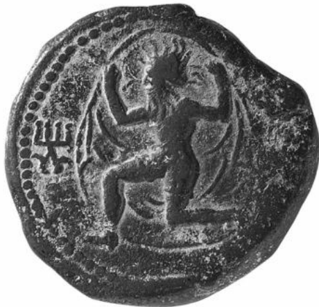
Мал. 5. Кушанська монета із зображенням Оадо (Вайу), Канішка I, 128–150 pp., London, British Museum 1989,0904.4011