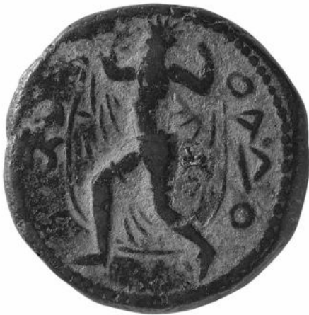
Мал. 3. Кушанська монета із зображенням Оадо (Вайу), Канішка I, 128–150 pp., London, British Museum 1894,0506.1423