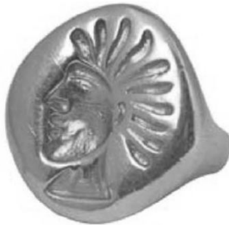
Мал. 4. Золотий перстень з кургану Іссик (Казахстан), IV–III ст. до н. е. (за: [Stöllner, Samasev 2013, 175 (cat. 467)])