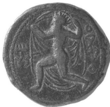
Мал. 2. Кушанська монета із зображенням Оадо (Вайу), London, British Museum (за: [Shenkar 2014, 333, fig. 145])