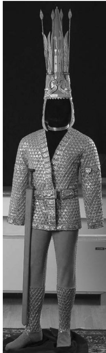
Мал. 9. Реконструкція вбрання “золотої людини” з кургану Іссик (за: [Stöllner, Samasev 2013, 175 (cat. 467)])

Наведені спостереження, на наш погляд, ставлять під сумнів надзвичайно поширене серед скіфологів від часів розробок А. К. Акішева уявлення про асоціацію “золотих людей” із “солярним” Мітрою та колом мітраїстичних уявлень, начебто