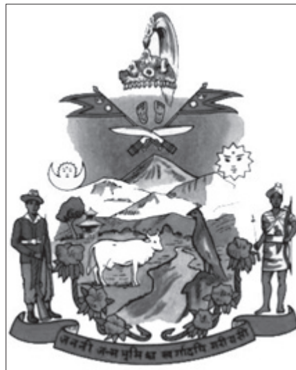
Старий герб Королівства Непал – один з найскладніших у світі

Заклики змінити національний прапор вперше прозвучали з вуст представників Комуністичної партії Непалу (маоїстська), а численні організації різних етносів країни підтримали їх. Доводи за зміну прапора можна підсумувати в основному в таких чотирьох пунктах: