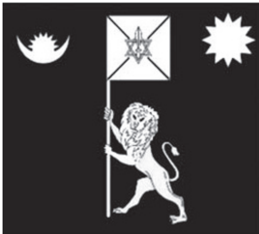
Королівський штандарт, прапор монарха

Яскравою ілюстрацією цього факту є і недавня політична подія в Непалі. Коли вікова монархія була усунена рішенням всенародно обраної Конституційної асамблеї 28 травня 2008 р., останній король династії Шахів Гіянендра, як відомо, змушений був зняти свій чотирикутний прапор із зображенням лева з флагштока палацу Нараянхіті після проголошення Непалу республікою. Замість цього королівського прапора підняли національний прапор. Та й учасники всенародного руху за повну демократію в країні несли у своїх руках, крім прапорів різних партій, і національний прапор.