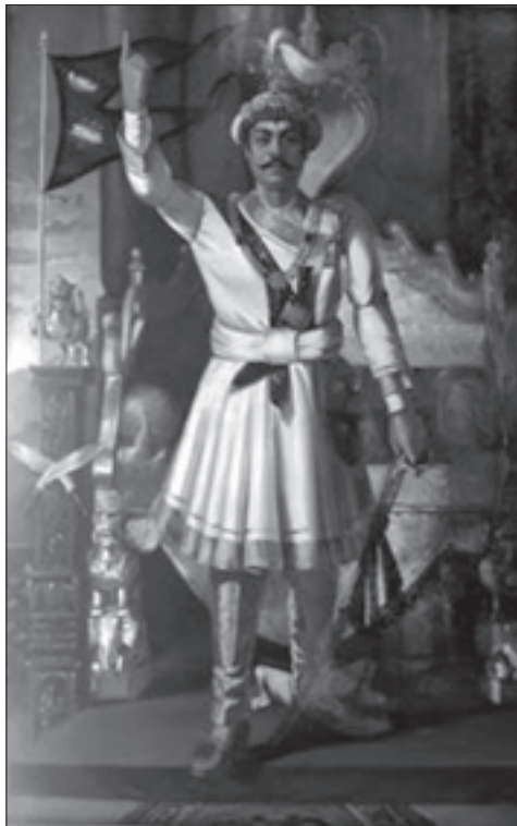
Традиційне зображення короля Прітхві Нараяна Шаха – зліва від короля непальський прапор

Цей прапор був у вжитку ще задовго до появи клану прем'єр-міністрів магараджів Рана в Непалі в середині XIX ст. Воїни Прітхві Нараяна Шаха, першого короля єдиного Непалу, підняли саме такий прапор у Катманду на знак завоювання князівства Катманду 1768 р., а непальські війська, як вважають історики, йшли на війну за об'єднання країни в єдину державу у XVIII–XIX століттях під цим же прапором. Це свідчить про те, що різні князівства, що виникли в різних регіонах сучасного Непалу, шанували прапор із двома трикутниками як спільний прапор, успадкований з ведичних часів.