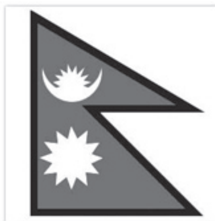
Прапор Непалу (сучасний вигляд, використовується з 1962 року)