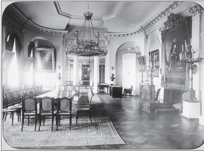
Илл. 1. Зал заседаний Лазаревского института