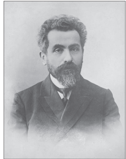
Илл. 2. Портрет академика Н. Я. Марра